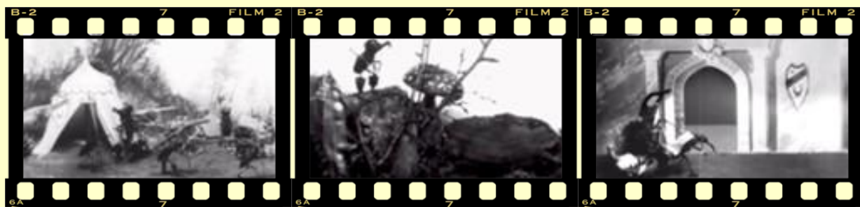
«Прекрасная Люканида, или Война усачей с рогачами» (1912)

Биолог по образованию, свой первый фильм он решил снять про насекомых. Однако жуки при свете камеры вели себя совсем не так, как предполагалось для обучающей документальной картины, и тогда Старевич препарировал их, вставив в тельца насекомых тонкую проволоку. Теперь полностью послушные, чучела делали именно то, что нужно режиссеру. Так и родились знаменитые мультфильмы, изумлявшие публику и в России, и за рубежом. Газеты восторженно писали о феноменальном таланте Старевича дрессировать жуков, а сам режиссер не стремился разубеждать наивных зрителей.