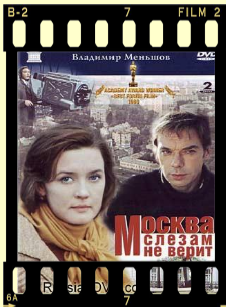
«Москва слезам не верит»

Несмотря на то, что многие фильмы 1970-х легли на полку, а другие если и выходили, то крошечным количеством копий, некоторые шедевры все-таки добивались до экранов — речь о фильмах, которые стоит посмотреть всем, режиссеров Глеба Панфилова, Василия Шукшина, Никиты Михалкова, Ролана Быкова. Именно в эти годы на экраны вышла картина «Москва слезам не верит» Владимира Меньшова, получившая в итоге «Оскар». Продолжали снимать свои кассовые комедии и Гайдай, и Данелия, и Рязанов. А зрители шли в кинотеатры не столько на фильмы, сколько на имена — Андрея Миронова, Анатолия Папанова, Людмилу Гурченко, Евгения Леонова, Юрия Богатырева, Александра Кайдановского.