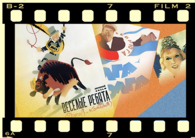
Фильмы Григория Александрова

«политикой партии» — например, «королю комедии» Григорию Александрову и его музе Любови Орловой, с именами которых связано рождение не только нового жанра, но и приход на экраны музыки.