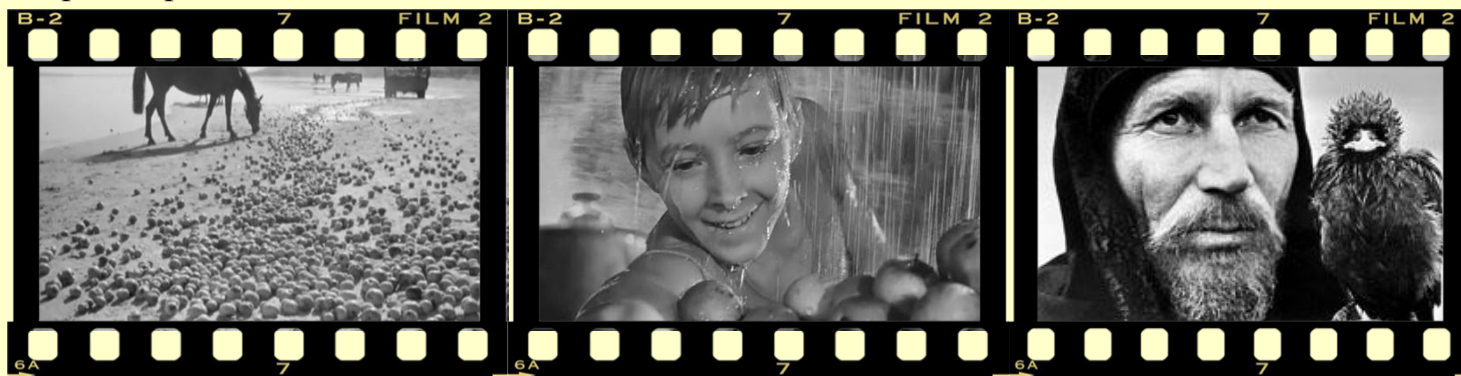
Кадры из фильма «Иваново детство»

Именно в 60-е свои первые шедевры — «Иваново детство» и «Андрей Рублев» — снял Андрей Тарковский.