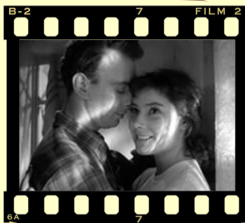
Фильм «Летят журавли»

На экранах снова можно было смотреть комедии, совсем другие, снятые Леонидом Гайдаем, Эльдаром Рязановым, Георгием Данелией, сказки и экранизации литературной классики. В том числе и «Войну и мир» Сергея Бондарчука — картину, получившую премию «Оскар».