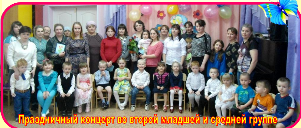
Праздничный концерт во второй младшей и средней группе

Ребята поздравляли своих мам, бабушек, сестер! Благодаря праздничным концертам, подготовленным детьми, этот день стал памятным для всех присутствующих. Было спето немало песен, рассказано стихотворений, сказано добрых слов. Ребята не только показали музыкальные номера, поиграли с мамами и бабушками, станцевали для них, и подарили открытки, сделанные с любовью.